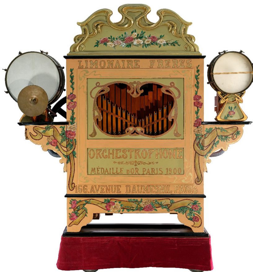
Jahrmarktsorgel, Limonaire Frères, 1908