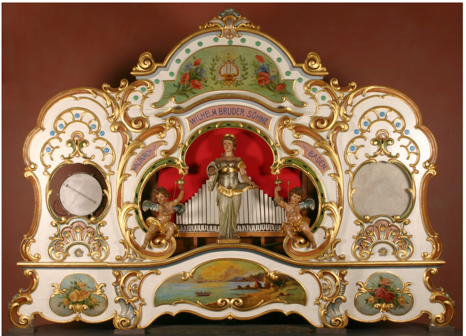
Konzert-Notenorgel, Wilhelm Bruder Söhne, 1923