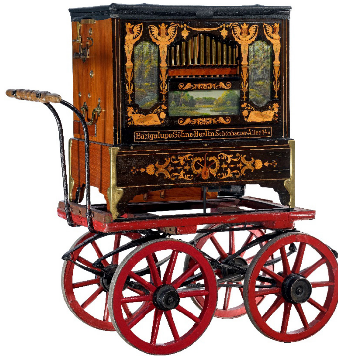
Drehorgel, Bacigalupo-Söhne, 1926